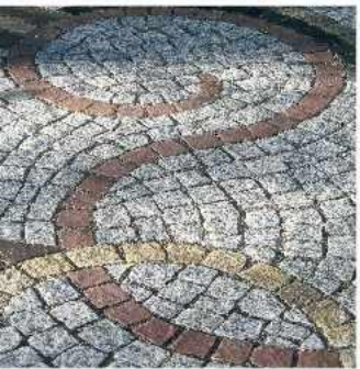
Unsere Spezialität: Freie Mosaik-Technik