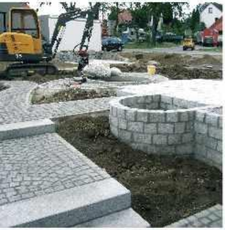
Baustelle während der Ausführung