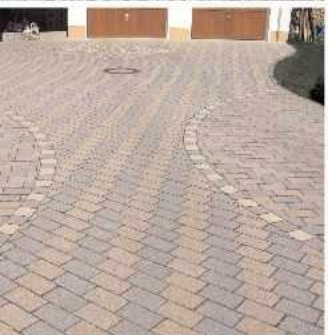
Betonstein einmal anders