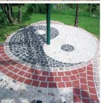
Terrazzo-Technik kombiniert mit rotem Granit und Klinkern